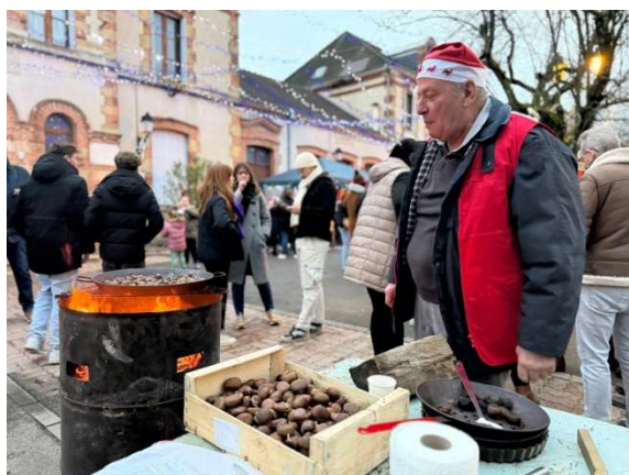
Chaud, les marrons, chaud !