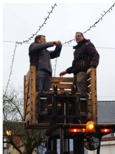
Des experts électriciens à l'œuvre.