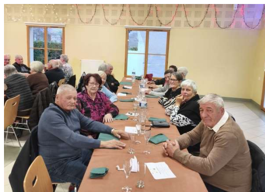
Vues des différentes tables...