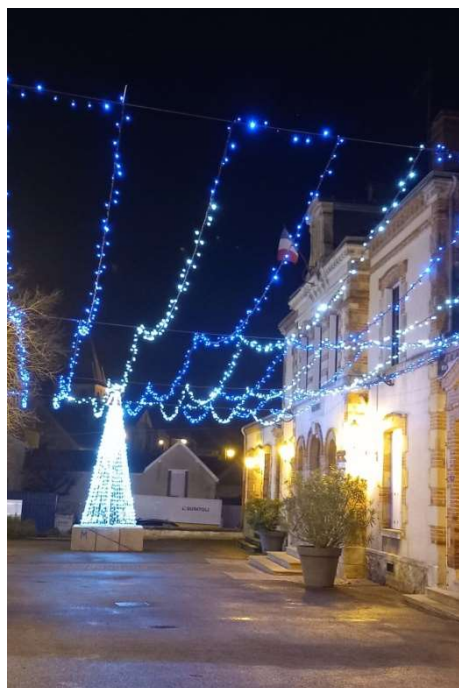
Tout ça pour ça, ça claque quand même !