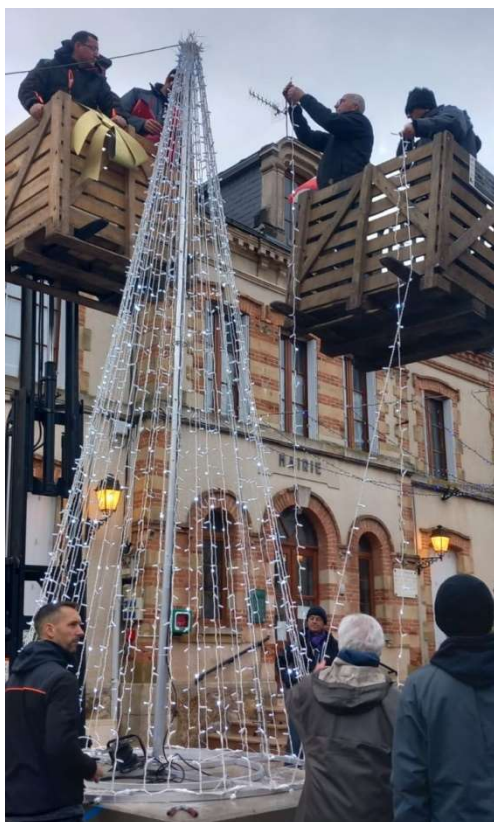
Normalement cela ne tombe pas, les années se suivent mais...