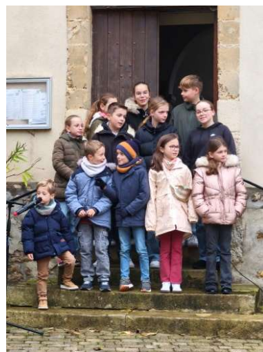
Ils ont chanté la Marseillaise...