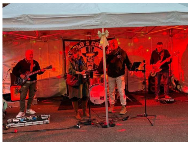
Reprise du concert !