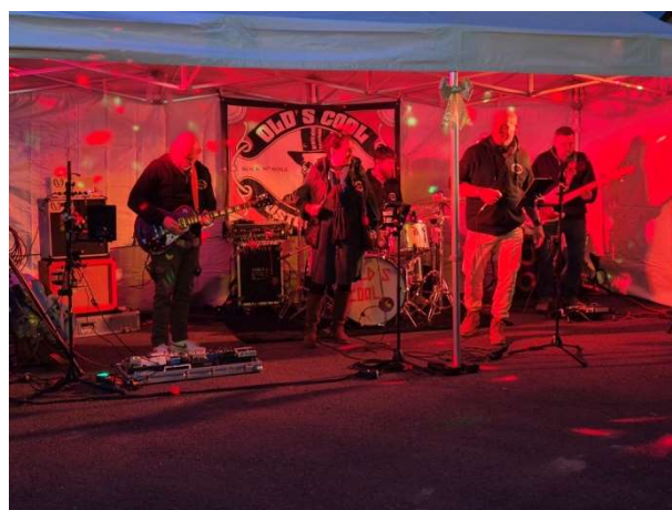
Un grand merci à eux d'avoir répondu présent si rapidement. Faîtes du bruit !