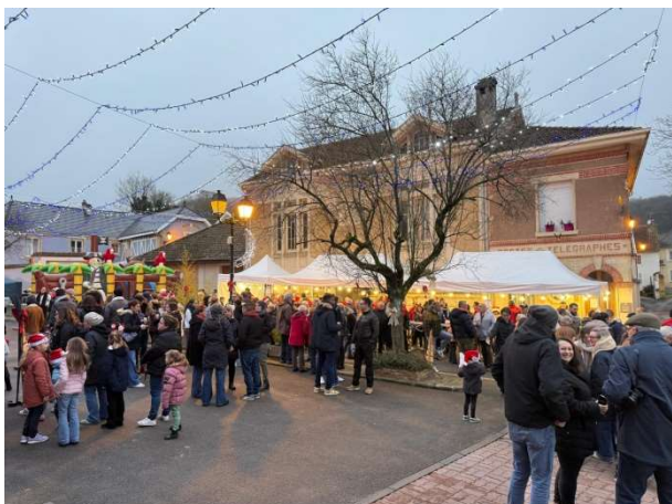
Déjà du monde en fin de cet après-midi...