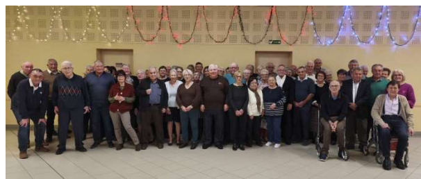
Vue d'ensemble des participants.