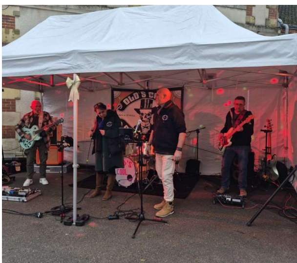
Pour accueillir le groupe vedette !