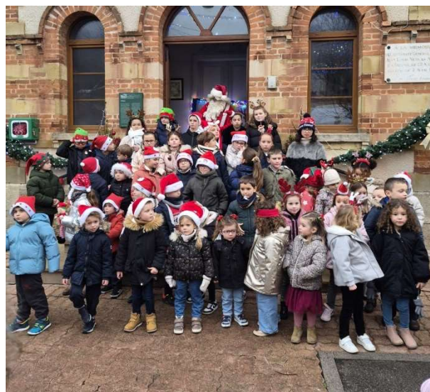
Voici la chorale de Noël avec en superviseur le Père Noël en personne !