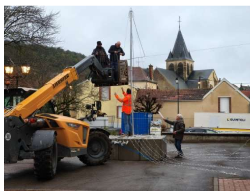
Ça change d'un vrai sapin !